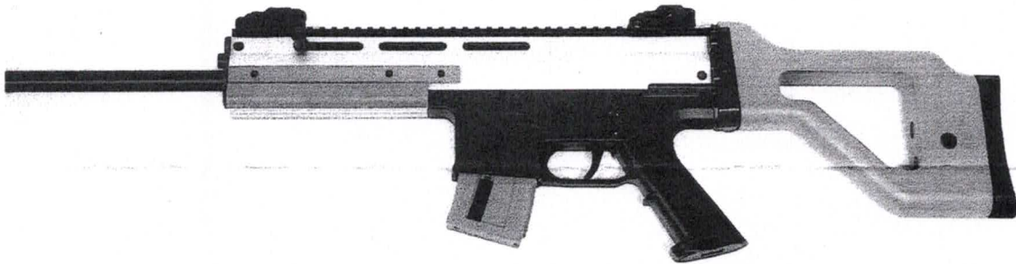
Abbildung 1: German Sport Guns „GSG-15“, Kal. .22lr, Ansicht linke Seite

mit oben genanntem Antrag haben Sie um die Beurteilung gebeten, ob für die halbautomatische Schusswaffe Modell „GSG-15“ in dem Kaliber .22lr der Firma German Sport Guns mit fester Schulterstütze, in der in Abbildung 1 abgebildeten Bauform Ausschließungsgründe vom sportlichen Schießen gemäß § 6 AWaffV vorliegen.